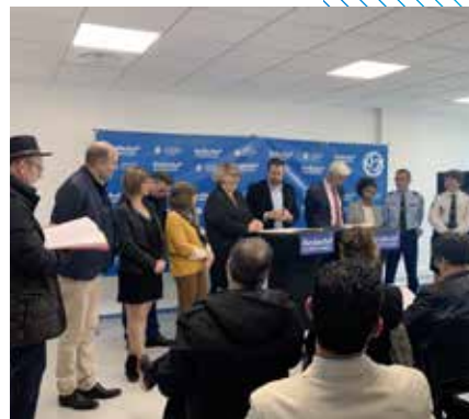
Présentation du Plan d'action départemental de lutte contre les violences faites aux femmes