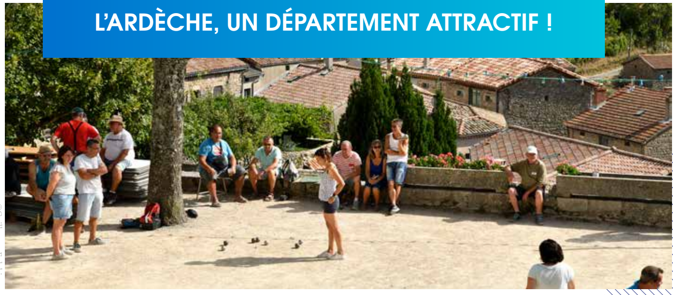
Partie de pétanque sur la commune de Chalencourt