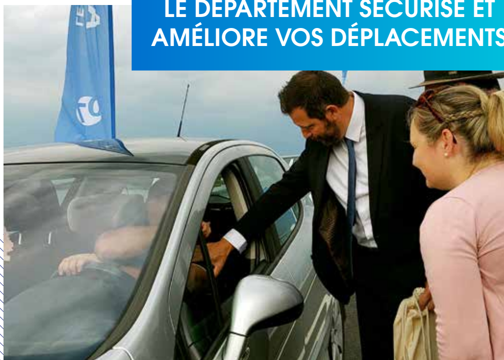
Lors du passage des premiers véhicules sur le nouveau pont de Charmes-sur-Rhône