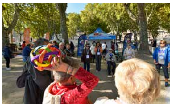
La Journée Séniors organisée à Tournon-sur-Rhône fin septembre dans le cadre de la Semaine des sports et loisirs de nature a rencontré, cette année encore, un grand succès !

avoir passé de nombreuses étapes administratives. Ce stade, d'une capacité de 4 000 spectateurs, sera construit à côté de la déviation, en face de l'entreprise Sabaton. Le montant des investissements s'élève à 6,5 millions d'euros, financés par le Département (1 M€), la Région (2 M€), l'Etat (1,5 M€) et le Rugby club Aubenas Vals - RCAV (2 M€). La communauté de communes du Bassin d'Aubenas-Vals et la commune d'Aubenas financeront à part égale les coûts relatifs à la création des voiries et autres réseaux, estimés à environ 1,5 M€.