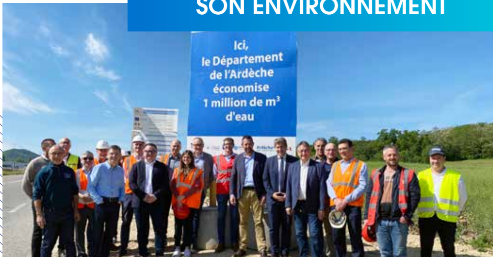
Tous les acteurs du projet se sont réunis pour une visite de chantier