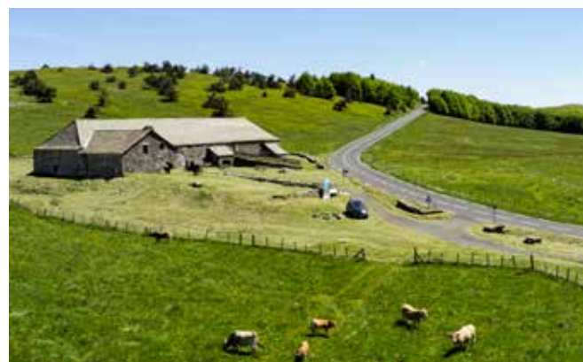
Ferme de Bourlatier à Saint-Andéol de Fourchades

+ d'infos : ardeche.fr/gerbier-de-jonc et ardeche.fr/bourlatier