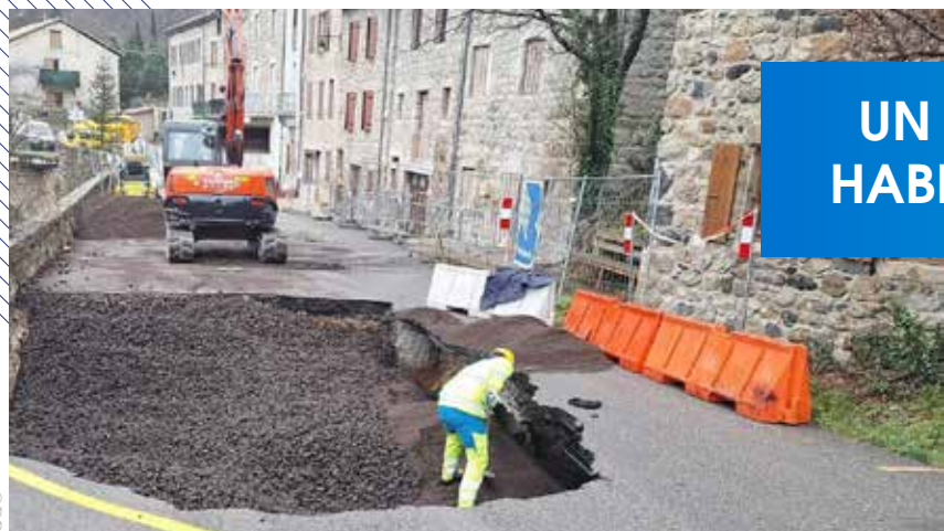
A Burzet, les travaux sur la route départementale 215 sont achevés.