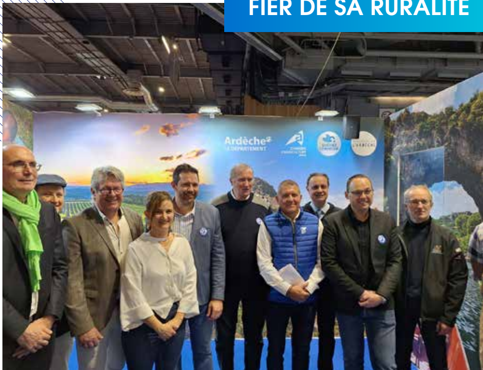
Élus départementaux et partenaires étaient réunis sur le stand Ardèche lors de la 61 e édition du Salon International de l'Agriculture de Paris.