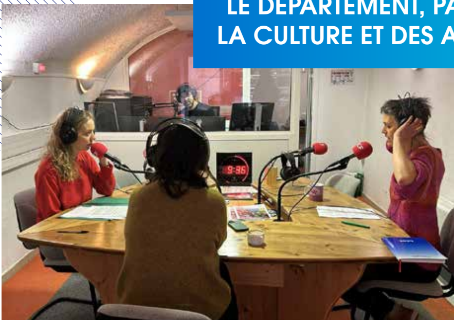
Le partenariat entre le Département et les radios associatives locales continue cette année encore avec les émissions Archivif, « un voyage entre culture, patrimoine et sports, au cœur du département de l'Ardèche ».