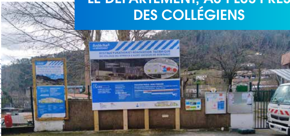
Le collège de Saint-Sauveur-de-Montagut est un bâtiment extrêmement vétuste, qui va faire l'objet d'une restructuration durant 4 ans.