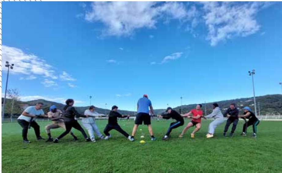
Le dispositif « Frapper fort sur le terrain de l'emploi » met en relation les entreprises partenaires des clubs sportifs et des bénéficiaires du RSA autour d'ateliers sportifs