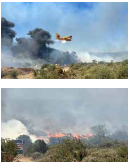
Incendies de juillet 2022 sur le secteur d'Aubenas