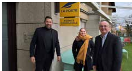
Depuis juin 2024, l'Ehpad Les Mimosas à Charmes-sur-Rhône accueille l'Agence postale

Le Département vient en soutien des investissements et des rénovations des Ehpad, avec près de 11 M€ depuis 2021, pour permettre aux personnes âgées de vivre dans de meilleures conditions.