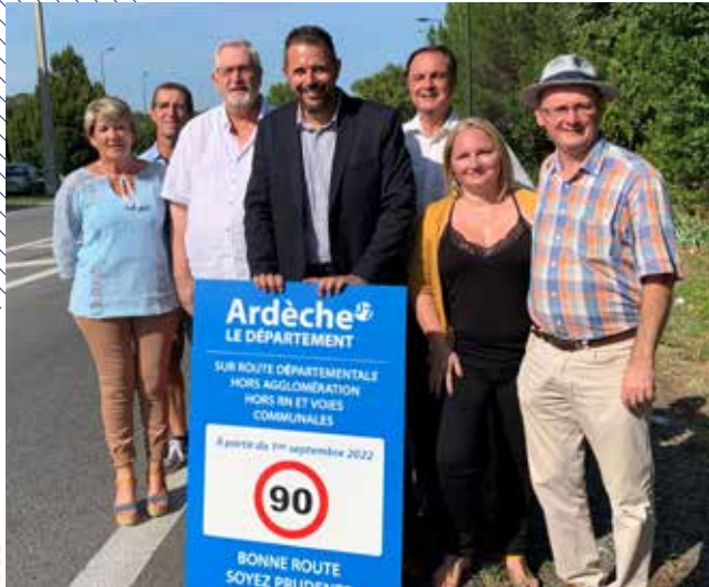
Le passage aux 80 km/h intervenu en 2018 avait été décidé de manière unilatérale et imposé sans concertation avec les élus locaux, ni prise en compte de la réalité des territoires ruraux. Depuis le 1 er septembre 2022, 3 800 kilomètres de routes ardéchoises sont repassés à 90 km/h.