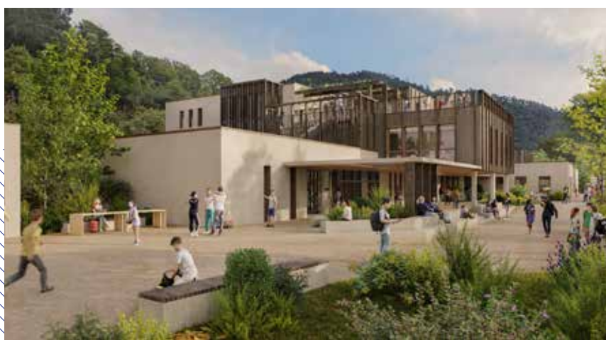
Le collège de Saint-Sauveur-de-Montagut est un bâtiment extrêmement vétuste, qui va faire l'objet d'une restructuration durant 4 ans.