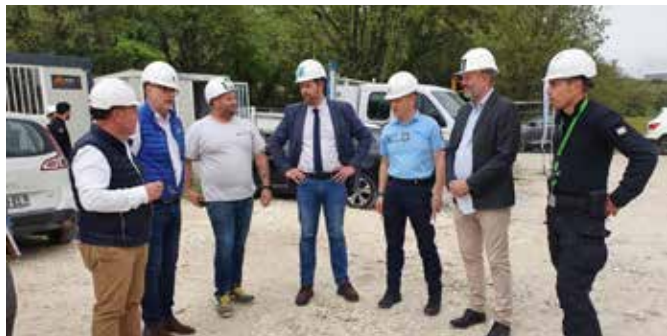
Début du chantier de construction de la gendarmerie de Meyssse avec Ardèche Habitat

- Secteur Centre : Meyssse : 46 gendarmes (peloton spécialisé de protection de la Gendarmerie)