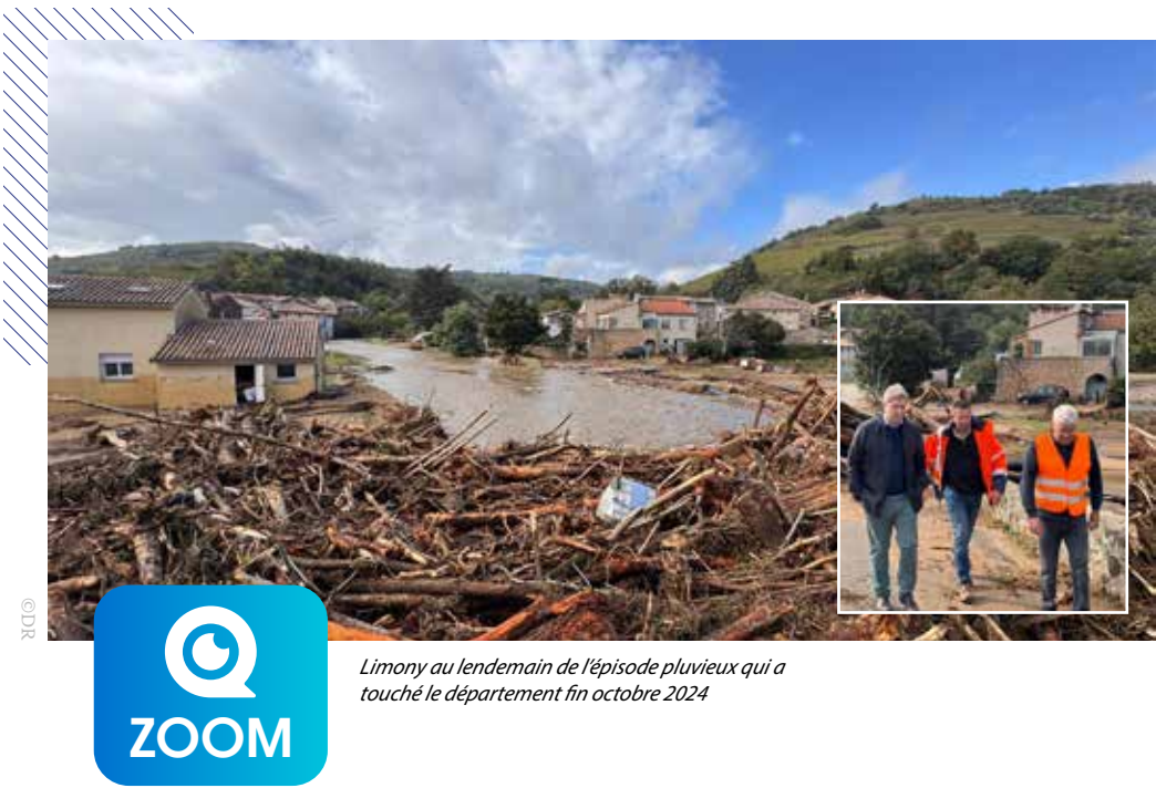
Limony au lendemain de l'épisode pluvieux qui a touché le département fin octobre 2024