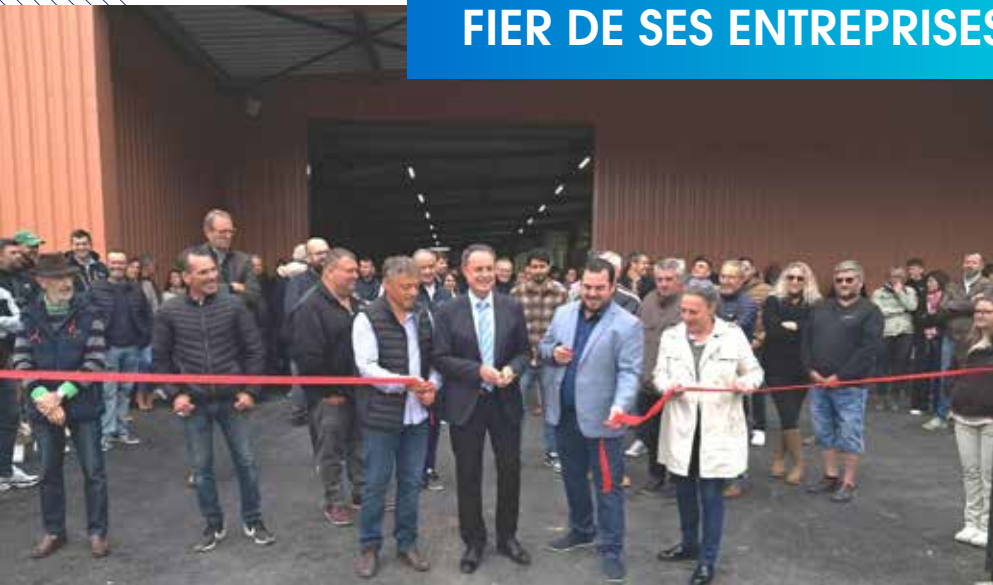
Inauguration de l'extension de BP Menuiserie à Lamastre