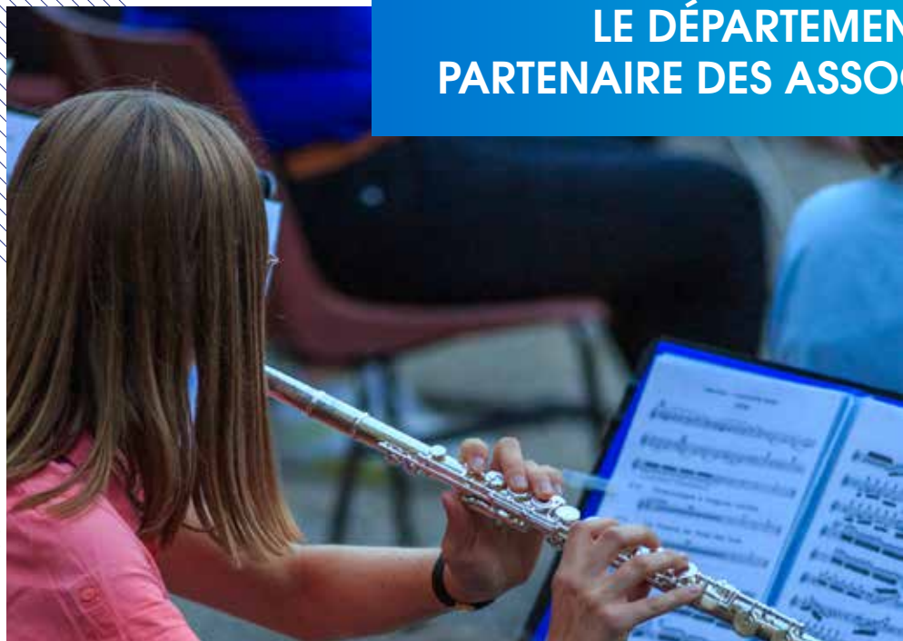
Théâtre, dessin et arts plastiques, musique, danse... le Bonus Collégiens 07 permet d'accompagner les familles dans les inscriptions à des activités culturelles (qui peuvent rester parfois onéreuses).