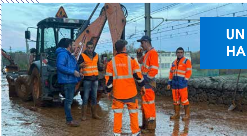
Mobilisation des équipes des routes suite à un éboulement et une coulée de boue sur la RD 86 à hauteur des Freydières à Soyons et sur la RD 2 entre Saint-Lager-Bressac et Saint-Vincent-de-Barrès.