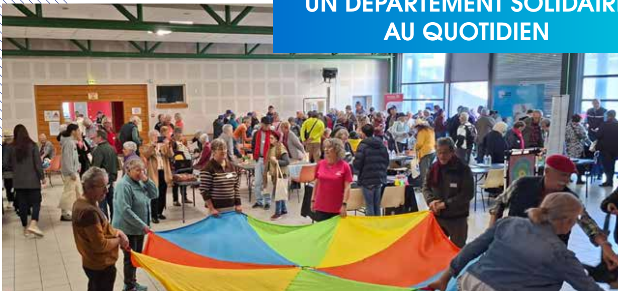
Ce temps de partage pour rompre l'isolement et célébrer le bien-vieillir en Ardèche a été plébiscité par les invités et les élus présents